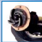
Liatinové obežné koleso