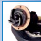
Liatinové obežné koleso