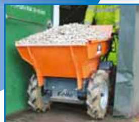
Flotačné pneumatiky pre mäkké podlažia